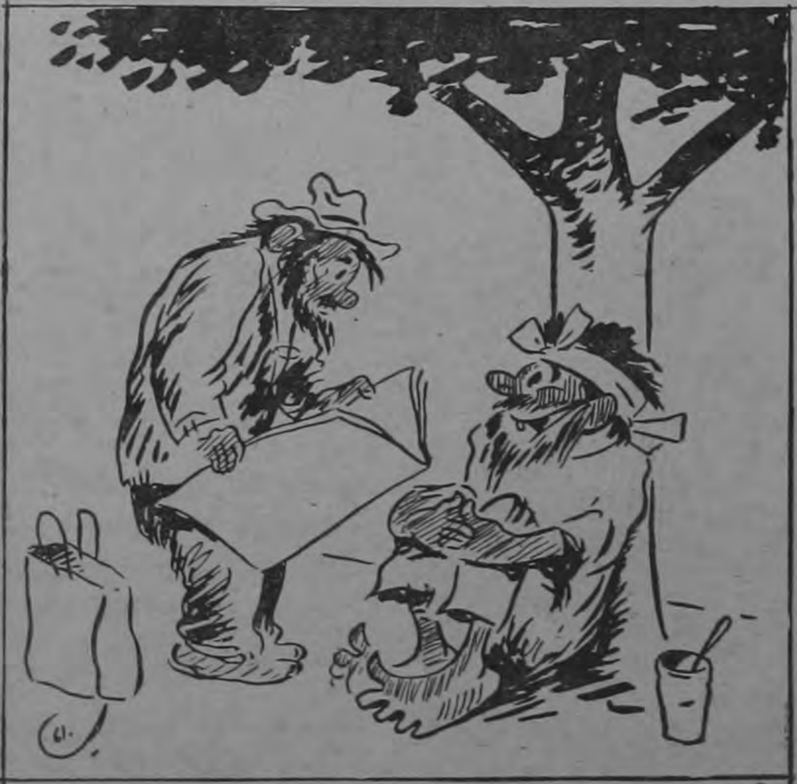
"LENGUA DE VACA".—Y q'es que se producirá un cierre de jabonerías por carencia y carestía de la materia prima p'a esa industria... "AZULITO".—Leeme lo de Tuzo. Eso del jabón, por mí y el cural...